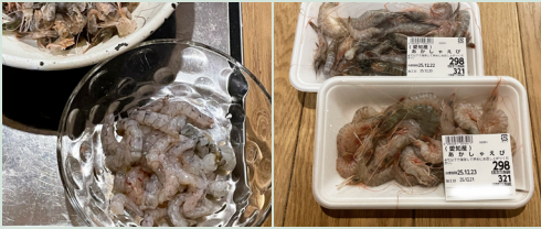
アカシャエビは流通名で雑多な小エビを総称してそう呼んでいるそう。えびせんべいの原料もこれ。小さくても味が濃い！